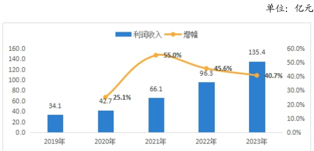
图 4：2019-2023 年全省国有资本经营预算利润收入趋势

3. 从支出结构来看。2023 年，国有资本经营支出合计 76.2 亿元，其中，国有企业资本金注入支出 53.6 亿元，占比 70.3%，2019 年-2023 年，资本金注入支出增速分别为 43.6%、-19.7%、98.5%和 2.7%，平均增速 23.8%。解决企业历史遗留问题及改革成本支出 3.1 亿元，国有企业政策性补贴支出 3.9 亿元，其他国有资本经营预算支出 15.6 亿元。