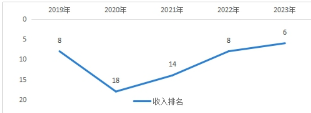
图 3：2019-2023 年长三角地区各省（市）国有资本经营预算收入趋势